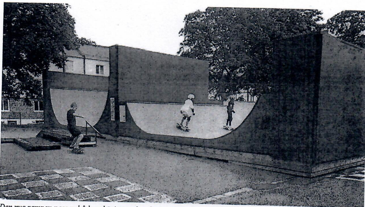
Den nya rampen passar både nybörjare och erfarna och rankas högt bland skejtare i Göteborg.

Efter mer än ett år av förberedelser: samtal med sponsorer, överläggningar med rampbyggare och diskussioner med MiK:s styrelse, var det plötsligt en dag i maj dags att bygga den fjärde Kålltorpsrampen, en 17 gånger 11 meter samlande punkt mitt i stadsdelen.