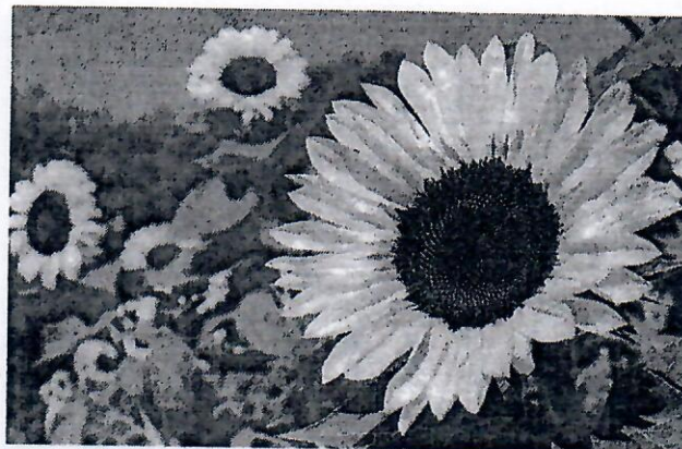
Framtidsdröm: ett helt hav av solrosor i Solrosparken.

Men några problem fanns det. När kommer jorden? tänkte vi. Och: vart tog timjanplantan vid