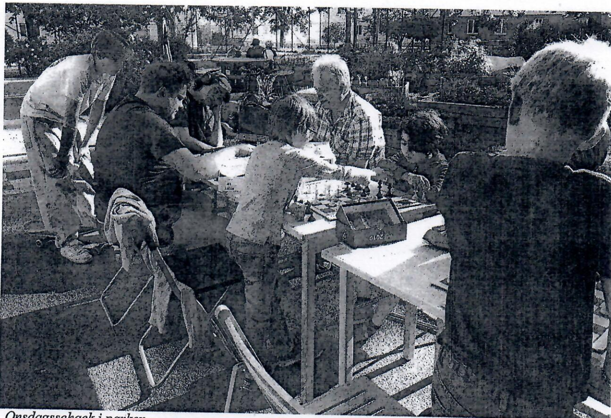
Onsdagsschack i parken